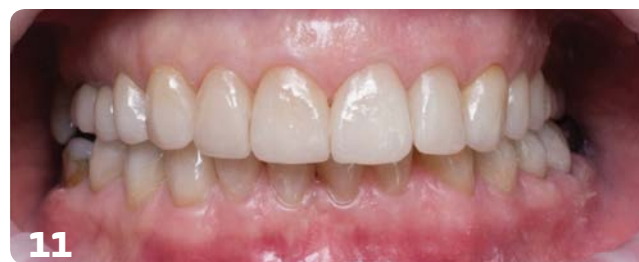
Kuvat 10-11: Esteettinen korjaus toteutettuna ultraohuilla laminaateilla ja osakruunuilla.