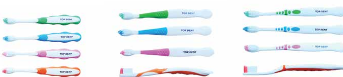
Vauva 0-3 v